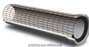
przekrój rury żelbetowej